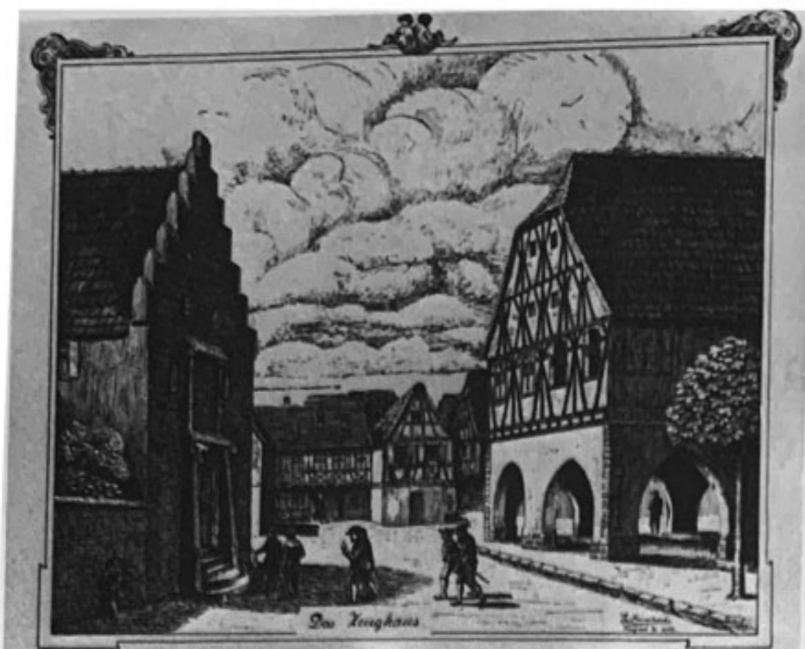
«Le Wachtmeisterhaus» acquise en 1649 par Niclus KESSEL