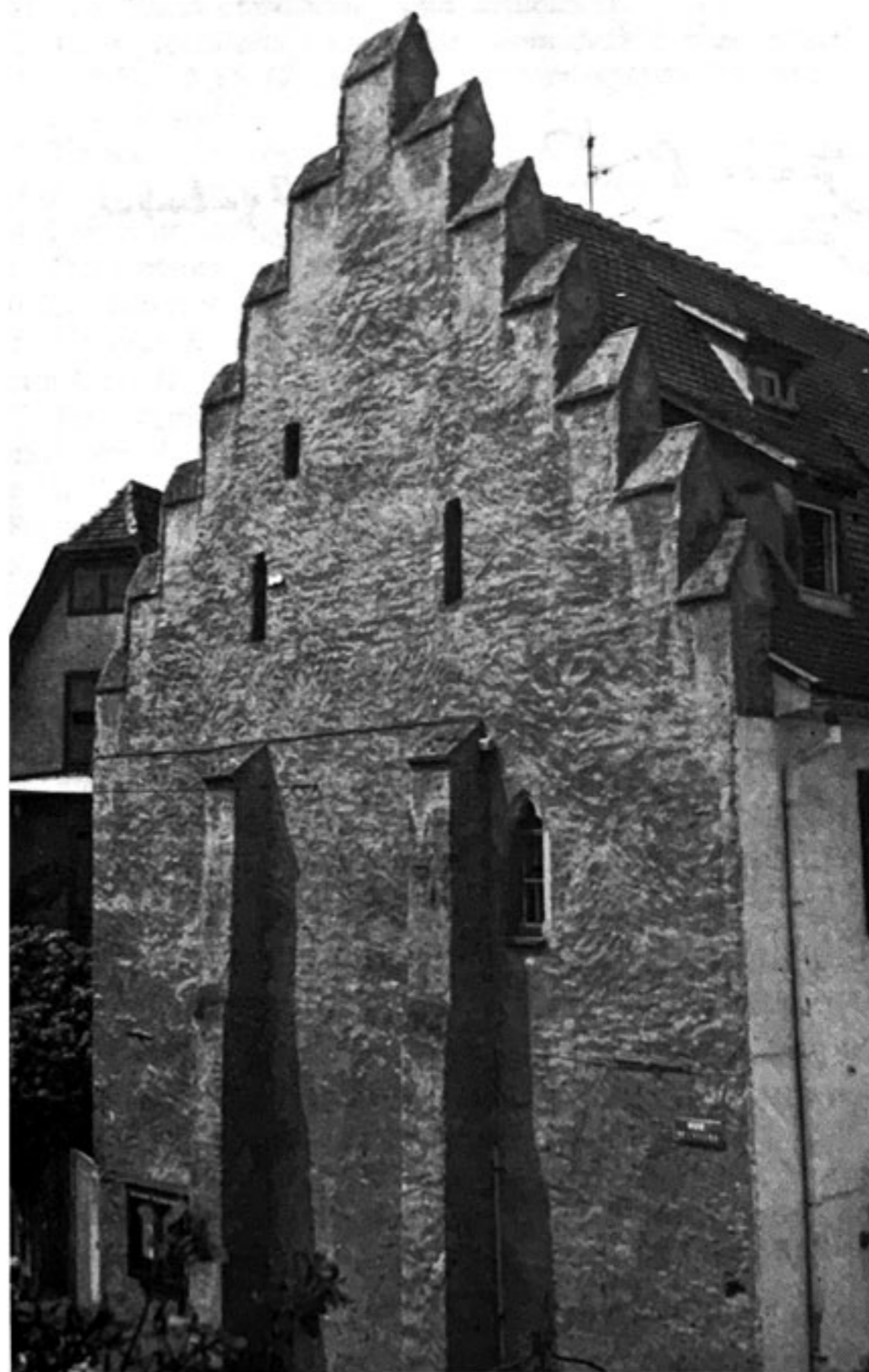
« Le Wachtmeisterhaus »

Vers 1644 commencèrent les difficultés financières pour la ville de Benfeld, dues à l'occupation des suédois, ce qui s'explique ; toute la garnison étant à la charge de la ville.